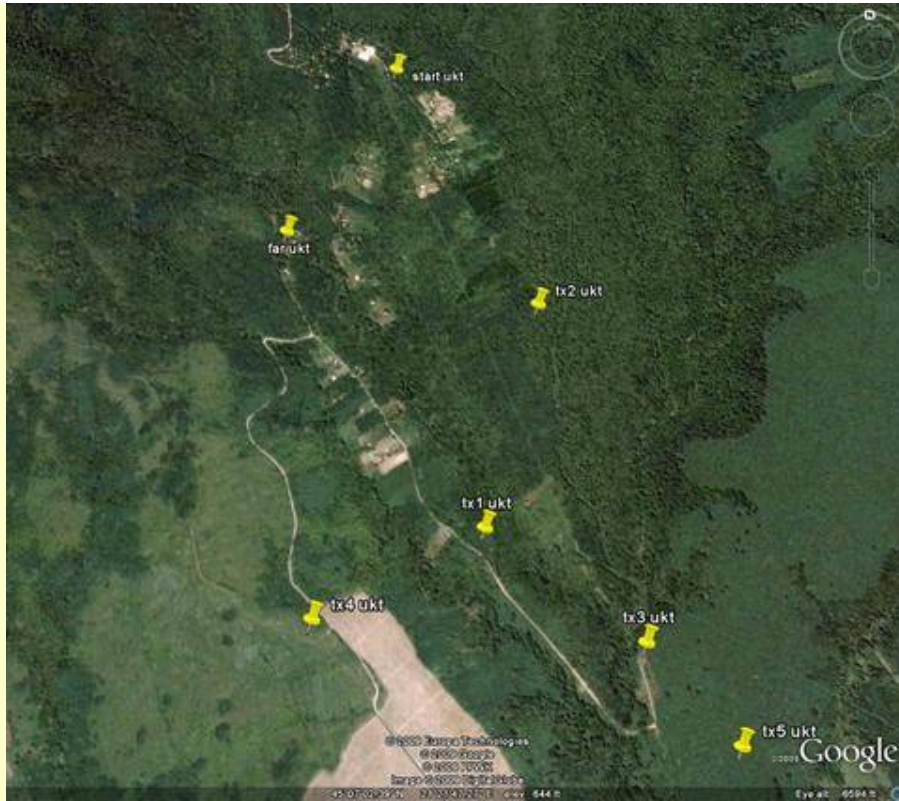
Raspored TX-ova na UKT